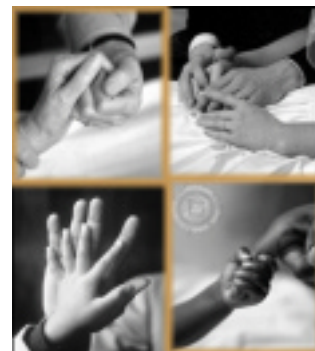
Gebets- und Seelsorge Team: