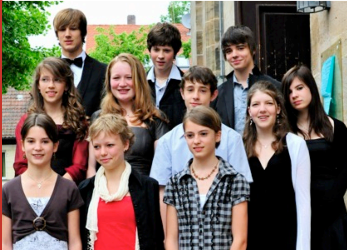
Die Konfirmanden 2009 alle auf einen Blick, aufgenommen vor dem Gottesdienst